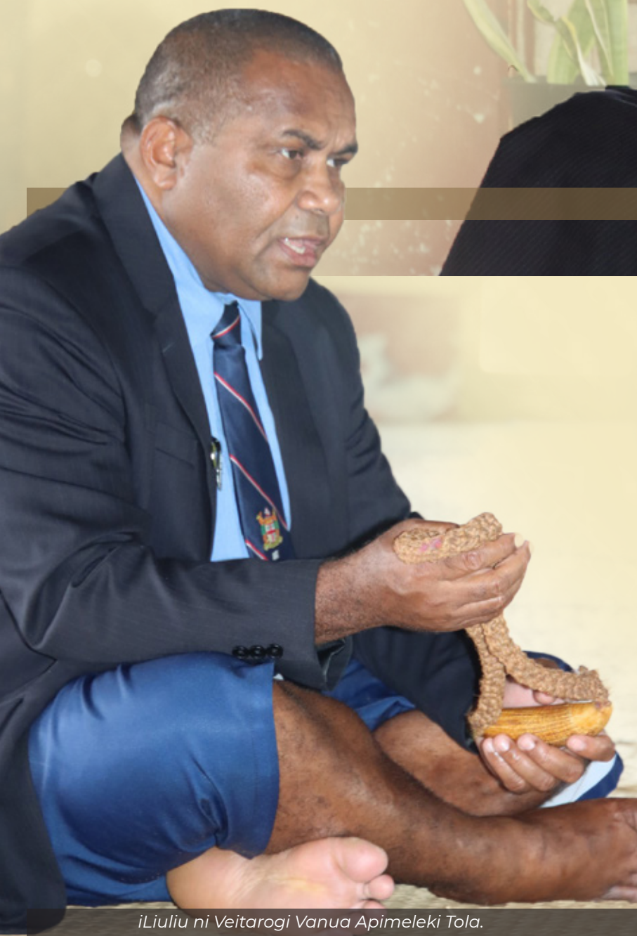
iLiuliu ni Veitarogi Vanua Apimeleki Tola.

E tamani tiko na ituvatuva ka qarava na Tabana ni Veitarogivanua, oya na nodra talevi ka vakararamataki na Turaga ni Vanua vakadeitaki vakaVeitarogivanua ena vakacokotaki ni veiliutaki vakaturaga vakavanua.