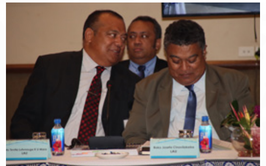
O ira na Lewenibose Levu Vakaturaga kei na ivakalesilesi ni Tabacakacaka iTaukei.

E ra a bulagoci na lewe ni Matabose Levu Vakaturaga ena vei tikini lawa ka virikotori ena Yavu ni vakavulewa ni 2013 ka vauci keda na iTaukei.