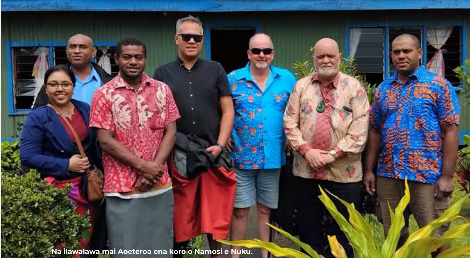
Na ilawalawa mai Aoeteroa ena koro o Namosi e Nuku.