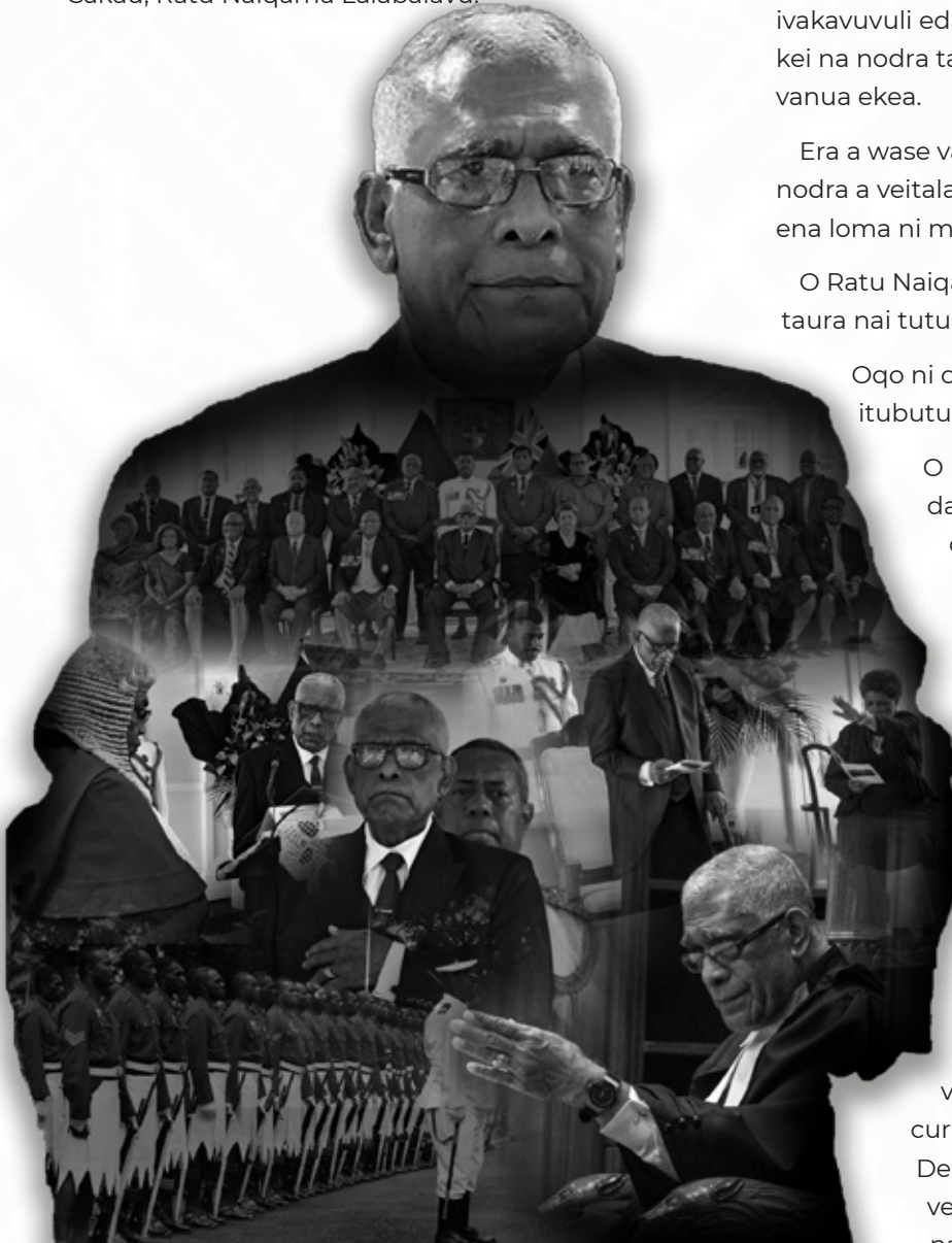
Ratu Naiqama Lalabalavu Head of State and Commander-in-Chief

Era a kidavaki vaka Matanitu ka vaka vanua talega ni oti na nodra curuma yani na nodra itikotiko vou e Delainaiqasiqasi e Draiba. Era a tiko ena veiqaravi vaka vanua oqo e lewe vica na noda Turaga bale mai na vei yasana ka ra a matataka yani na Bose Levu Vakaturaga.