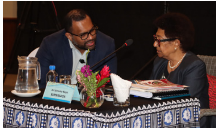
O ira na lewe ni bose ena bose siga rua ka vakayacori e Suva.