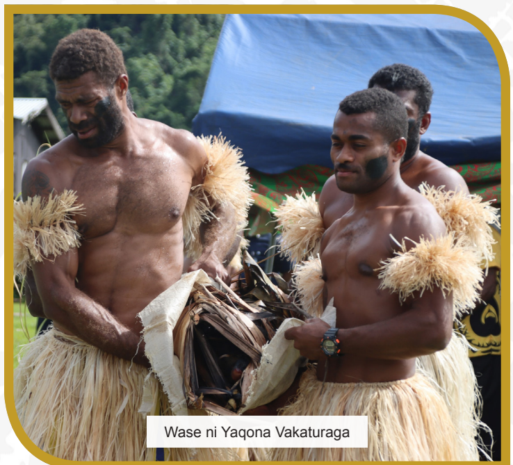
Wase ni Yaqona Vakaturaga