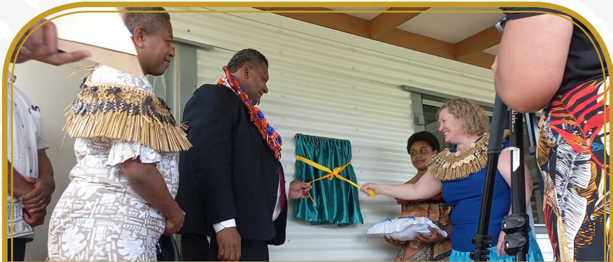
Dolavi ni Koronivuli e Bua District School Vakarautaka: Tabacakacaka iTaukei

“Na vuli e usuta ni Matanitu cokovata ka vakabibitaka talega na Minisitiri ni Vuli ni sa ikoya duadua ga ena rawa ni tarai caka noda vanua ena veisiga ni Mataka.