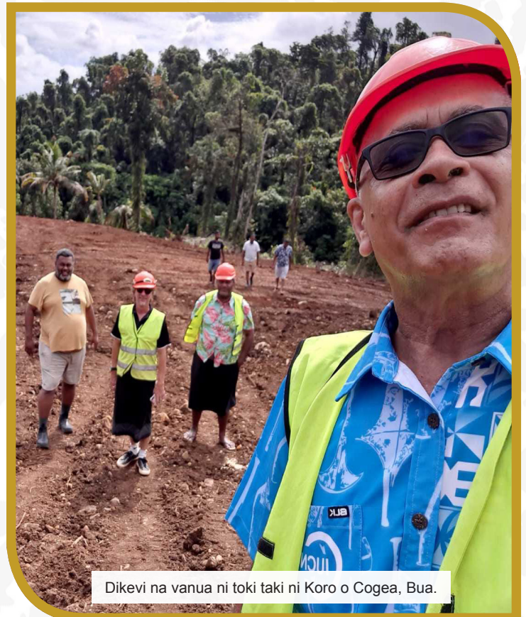
Dikevi na vanua ni toki taki ni Koro o Cogea, Bua.