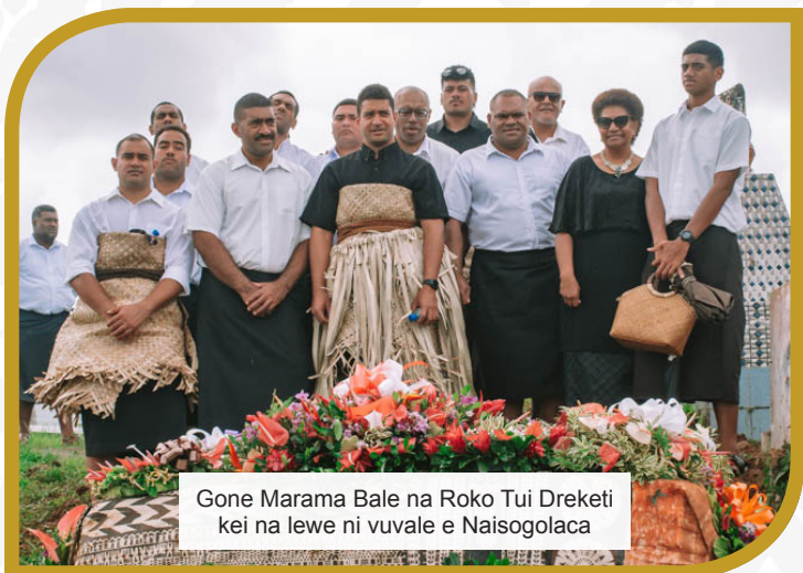
Gone Marama Bale na Roko Tui Dreketi kei na lewe ni vuvale e Naisogolaca