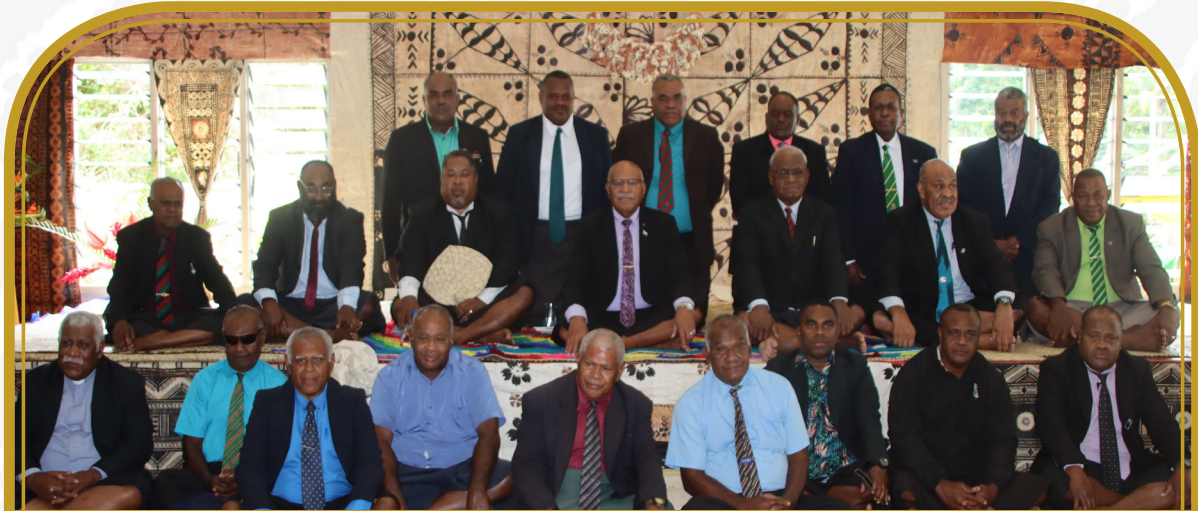
Bose ni Yasana o Ra Vakarautaka: Tabacakaka iTaukei