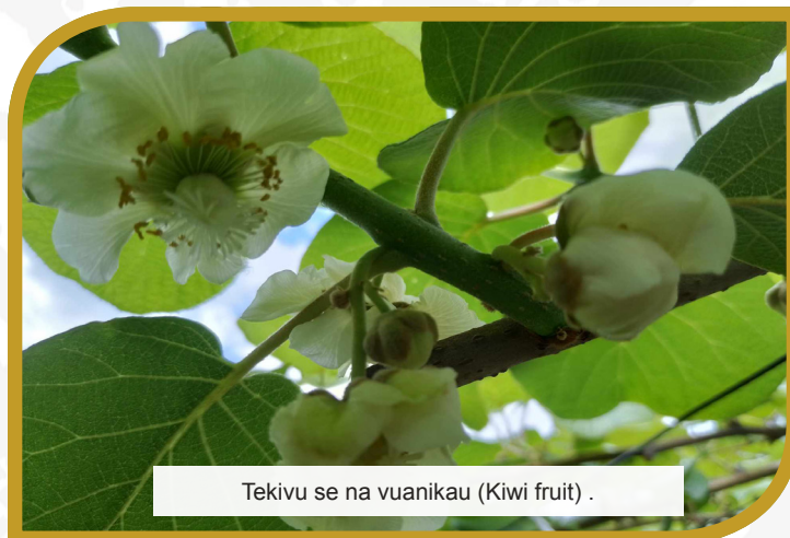
Tekivu se na vuanikau (Kiwi fruit) .