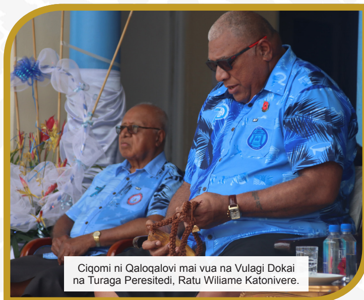
Ciqomi ni Qaloqalovi mai vua na Vulagi Dokai na Turaga Peresitedi, Ratu Wiliame Katonivere.

Na isulu ni vuli ena gauna oya na isulu vulavula, sote kei na kena beleti. E ra dau veiqati vinaka sara na gone ena veika vaka vuli ka vakakina na qito.