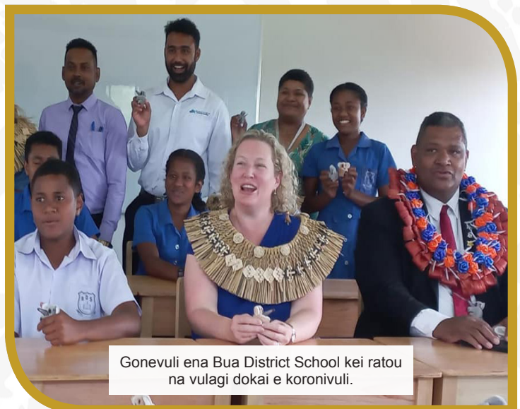
Gonevuli ena Bua District School kei ratou na vulagi dokai e koronivuli.