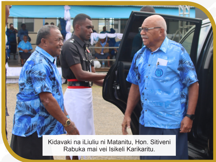
Kidavaki na iLiuli ni Matanitu, Hon. Sitiveni Rabuka mai vei Isikeli Karikaritu.

E 1891 e lewe 10 na cauravou mai na Yasana o Kadavu. Ena 13 na yabaki ni kena cici tiko na korovuli oqo mai Yanawai ea sotavi kina vei dredre eso ka vakabibi ena kena sa rui yawa mai Suva.