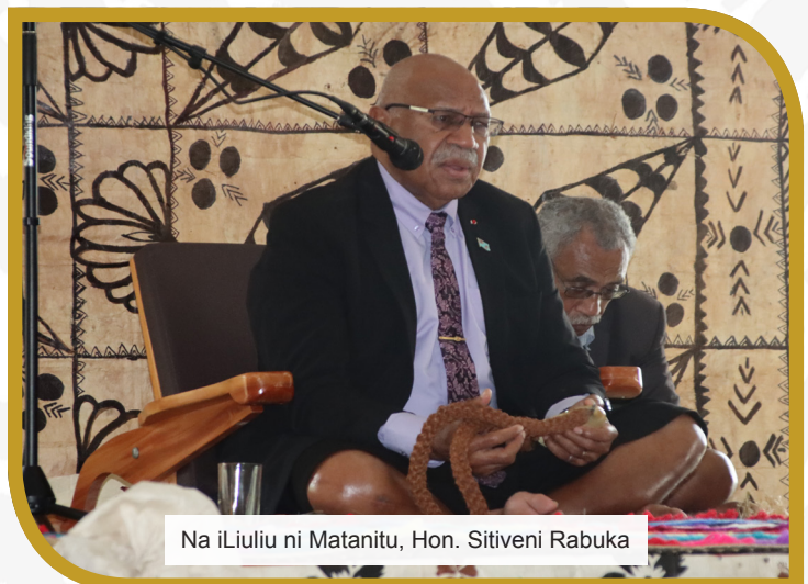
Na iLiuliu ni Matanitu, Hon. Sitiveni Rabuka

E kuria ka kaya ni sega ni naki vakalou me da dravudravua.