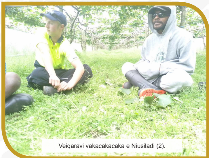
Veiqaravi vakacakacaka e Niusiladi (2).

“E sega sara ni levu na veika dredre keitou lai sotava baleta ni keimami tiko vata ga ka keimami veirairaici tiko vaka veiwekani ena vanua ni cakacaka.