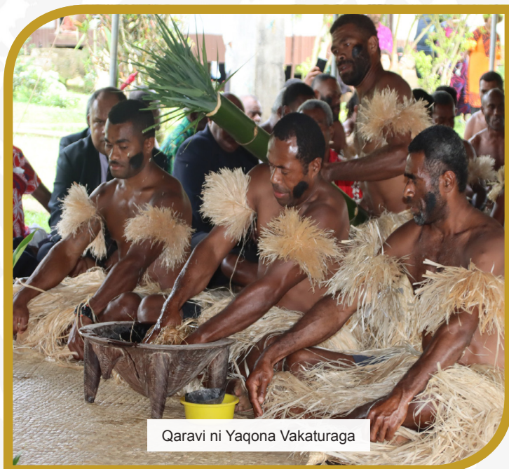
Qaravi ni Yaqona Vakaturaga

Sa vakamamasu na Tabacakacaka iTaukei meda raica tale mada na noda gauna ni veivosaki vakavuvale kei na kena vaqacotaki.