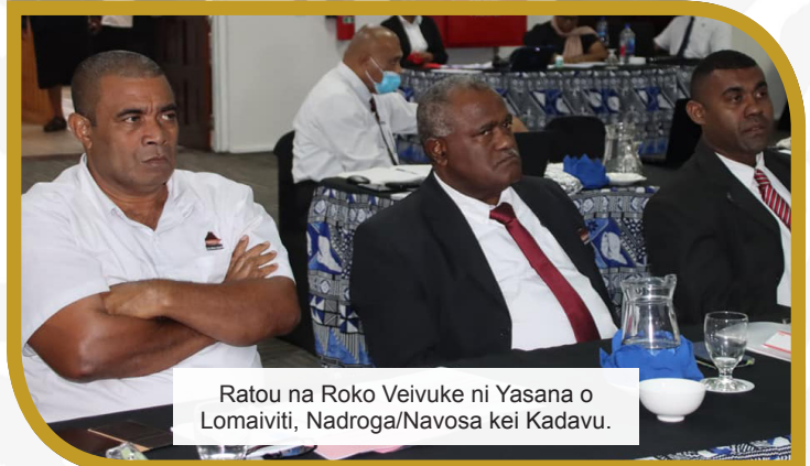
Ratou na Roko Veivuke ni Yasana o Lomaiviti, Nadroga/Navosa kei Kadavu.