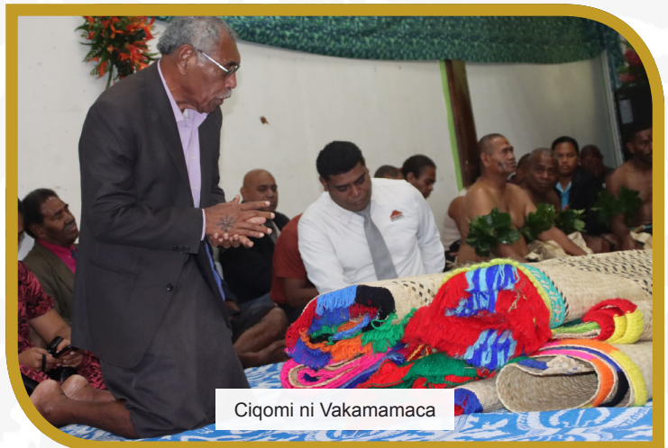
Ciqomi ni Vakamamaca