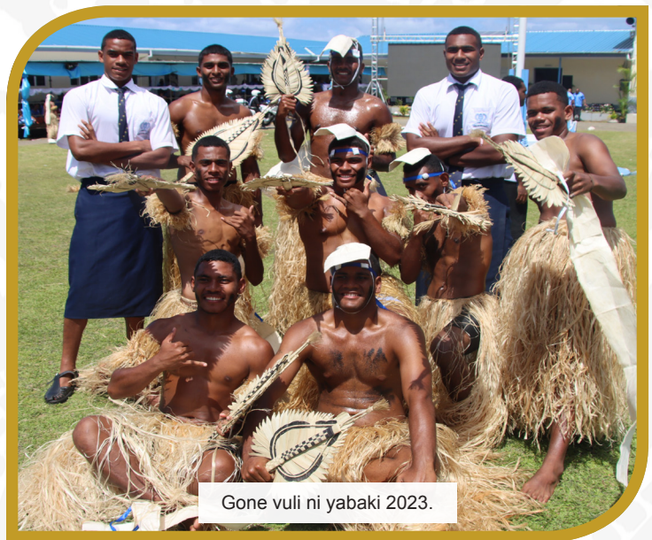
Gone vuli ni yabaki 2023.

Sa ratou cavu ikelekele e Lodoni ka vaka muria tu yani na baravi kei Tailevu ni Siga me yaco ni sa laki bala tale na ikelekele ena matasawa e Nukuvuto.