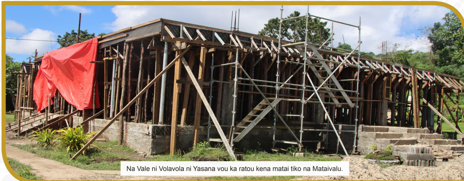
Na Vale ni Volavola ni Yasana vou ka ratou kena matai tiko na Mataivalu.

E kaya o Rabuka ni sa tekivu me vakilai na veiveisau sa yaco tiko ena loma ni yasana me vaka eratou vakaraitaka ena nodratou vosa ni tubetube na Yasana o Cakaudrove. Ea kidavaki vaka vanua o Rabuka ni bera ni qai tekivu na Bose ni Yasana.