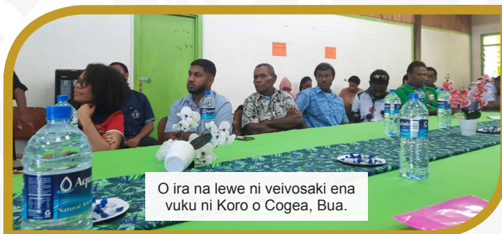
O ira na lewe ni veivosaki ena vuku ni Koro o Cogea, Bua.