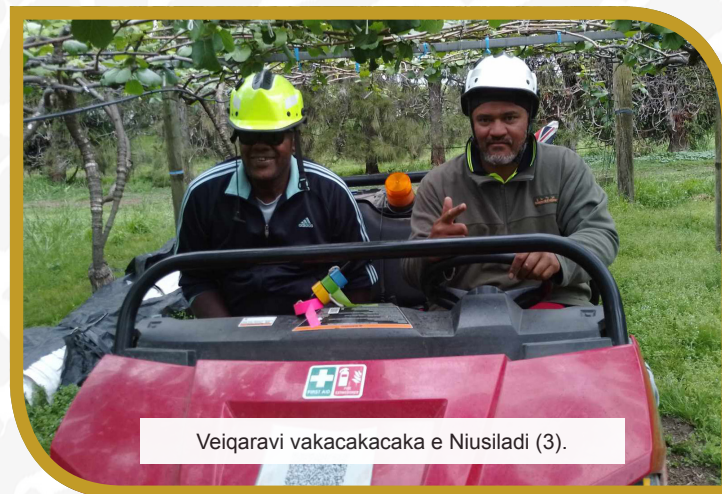
Veiqaravi vakacakacaka e Niusiladi (3).

E vakaraitaka talega o Iona ni dredre ni cakacaka e ratou veitauriliga taka vata kece ka dau rawarawa kina na toso tiko ena loma ni ono na vula ka ratou a veiqaravi tiko mai kina.