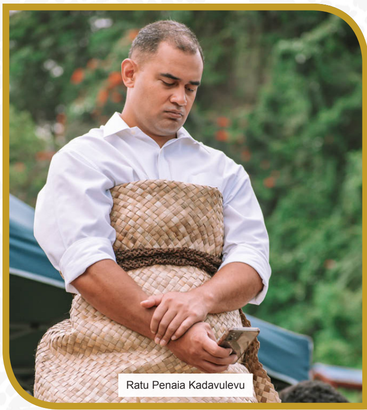
Ratu Penaia Kadavulevu