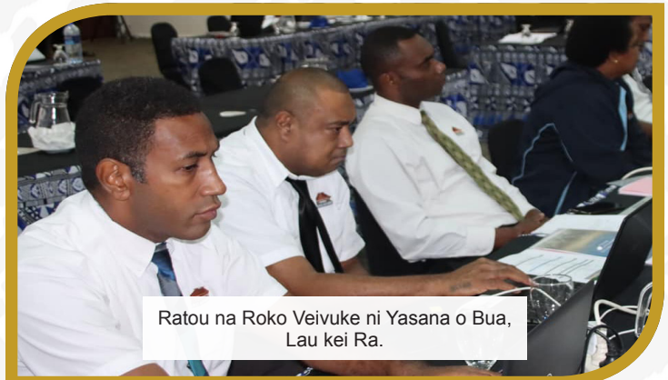
Ratou na Roko Veivuke ni Yasana o Bua, Lau kei Ra.