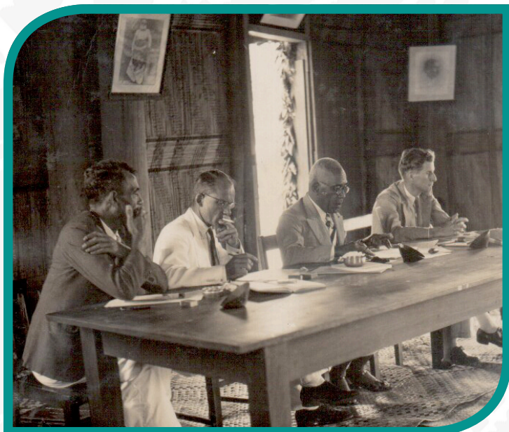
mera sucu na Turaga talai Sa Bale, Ratu Sukuna.

Ena 1905, sa pasitaki na lawa na Native Lands Ordinance, me yavutaki kina na veiqaravi ni valenivolavola ni veitarogi vanua.