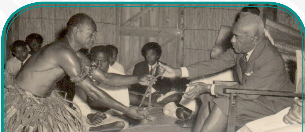
Tukutuku kei Ratu Sir Lalabalavu Sukuna Vakaraütaka: Tabacakacaka iTaukei

Na turaga talai sa bale, Ratu Josefa Vanayaliyali Lalabalavu Sukuna, era cavuisausau ena nodra veiqaravi; nira isevu ni itaukei mera vuli i Vavalagi, mera vakoroi, mera loya, mera komisina, mera veiliutaki ena veika vakaitaukei, mera komisina ni qele maroroi, mera speaker se iliuliu ni Bose lawa. Ena 1938, era a vagunuvu mera Tui Lau.